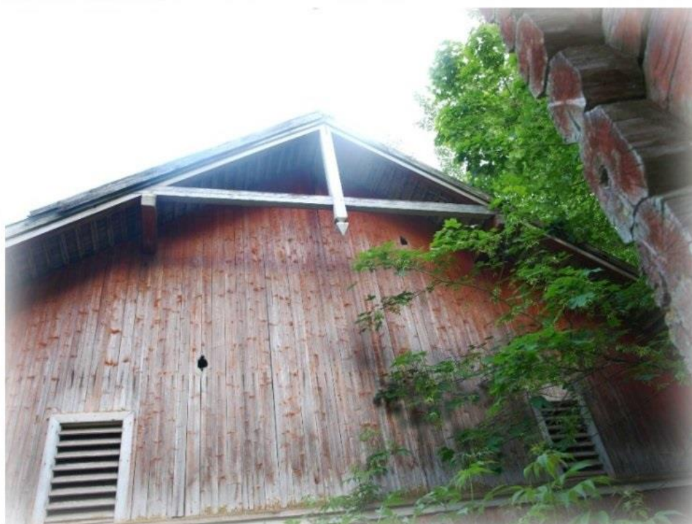
Bildet over: på både låve og stabbur er treverket friskt, maling med komposisjonsmaling vil være et ypperlig valg. Husk, malingstypen skal kun påføres flater som tidligere er malt med komposisjonsmaling